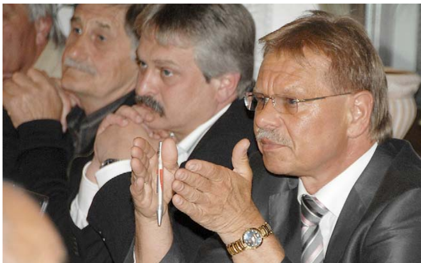
Bürgermeister Wolfgang Beiergröflein (rechts) konnte zu zahlreichen Themen Stellung nehmen.