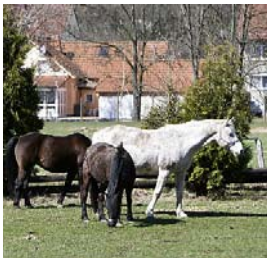
Der Reitverein Kronach-Dörfles besteht seit 1951.