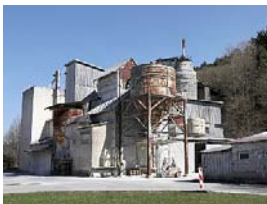
Das Kalkwerk steht am Ortsrand von Dörfles.