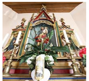
Ein Schmuckstück ist die Ortskapelle auch im Inneren.