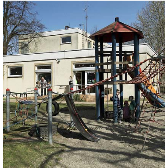
Der Außenbereich des Dörfleser Kindergartens lädt zum Spielen ein.