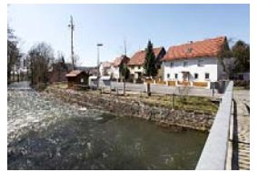
Die Kronach fließt mitten durch den Stadtteil Dörfles.

Im Jahr 1994 wurde die ehemalige Kläranlage am südlichen Ortsrand zu einer Natureisbahn umgebaut. Ein Jahr später wurde die baufällige Brücke in der Ortsmitte durch eine moderne Betonbrücke erneuert.