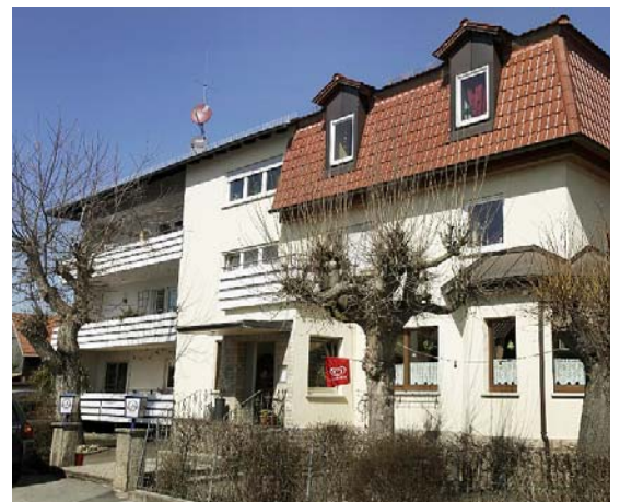
Im Gasthaus Wagner findet morgen die Veranstaltung „FT bei uns“ statt.