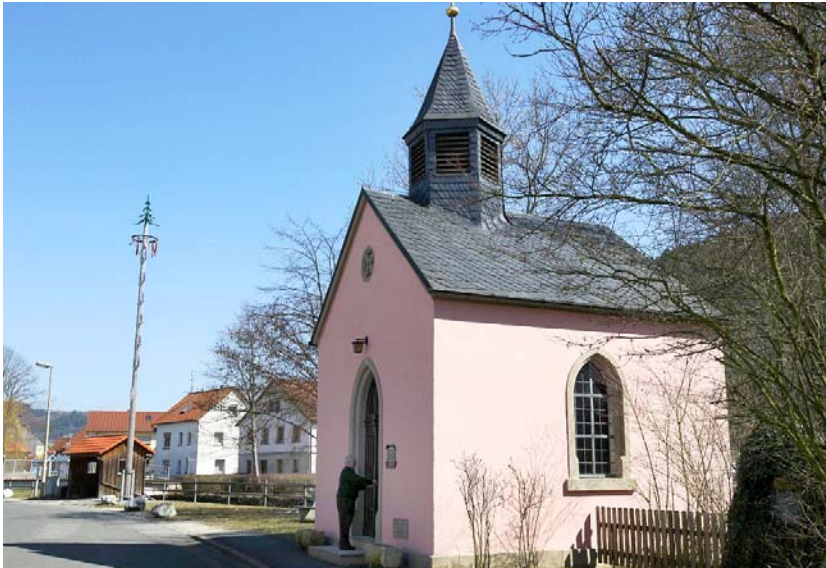
Die Ortskapelle von 1883 ist ein zentrales Gebäude in Dörfles.