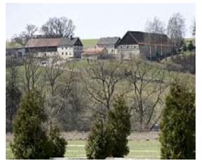
Der Rosenhof gehört noch zur Gemarkung Dörfles.