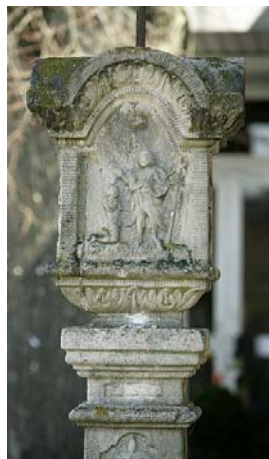
Die Sandsteinmarter in der Dorfmitte