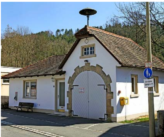
Das Feuerwehrhaus beherbergt seit 2001 ein Feuerwehrauto.