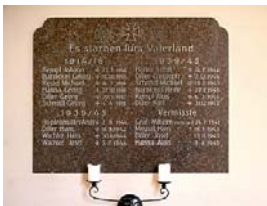
Das Ehrenmal erinnert an die Verstorbenen der Weltkriege.